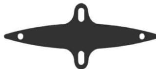
Embout à oreille